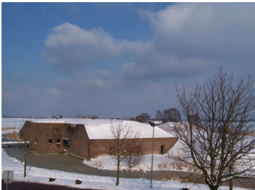
Het Muizenfort in de winter

Het bedrag voor de voorbereidingsfase is door de provincie voldaan.